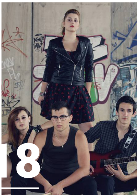
Cross the Ocean